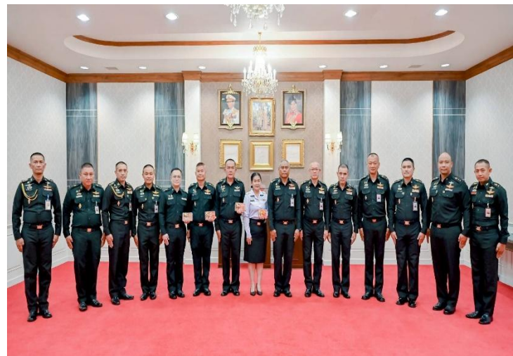
พล.ต. สุเมศ พูลมี, ผบ.ศร. ประธานในพิธีประดับเครื่องหมายโลหะสีทองรูปคทาไขว้ ประกอบช่อชัยพฤกษ์ และพิธีประดับเครื่องหมายยศให้กับนายทหารสัญญาบัตรที่ได้รับการเลื่อนยศสูงขึ้น จำนวน ๔ นาย ณ ห้องรับรอง (ชั้นบน) บก.ศร. อ.ปราณบุรี จว.ป.ข., เมื่อ ๗ พ.ย. ๖๘