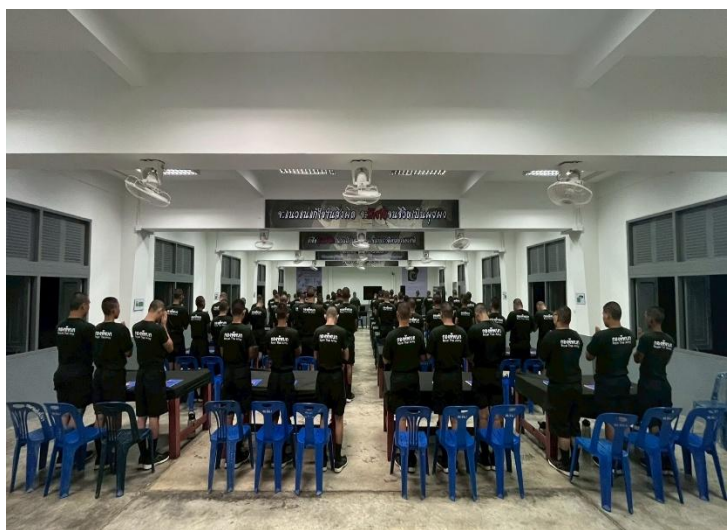
ร.ท. พันนา โพธิ์เกตุ ผ.อศจ.ศร. พบปะทหารใหม่ รุ่นปี ๒๕๖๘ ผลัดที่ ๒ (หน่วยฝึกที่ ๑) บรรยายอุดมการณ์ทหาร ด้านความรักชาติ ศาสน์ กษัตริย์, แนะนำการไหว้พระสวดมนต์ตามแบบธรรมเนียมทหารและพบปะทหารที่มีความเครียด ณ ห้องอบรม นพ.ทหารใหม่ที่ ๑ ศร.พน.๑, เมื่อ ๗ พ.ย. ๖๘