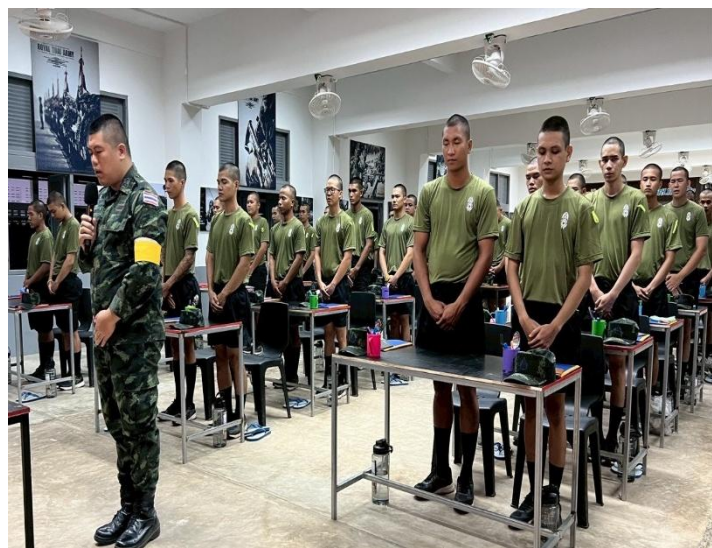
ร.ท. พันนา โพธิ์เกตุ ผ.อศจ.ศร. พบปะทหารใหม่ รุ่นปี ๒๕๖๘ ผลัดที่ ๒ (หน่วยฝึกที่ ๒) บรรยายอุดมการณ์ทหาร ด้านความรักชาติ ศาสน์ กษัตริย์, แนะนำการไหว้พระสวดมนต์ตามแบบธรรมเนียมทหารและพบปะทหารที่มีความเครียด ณ ห้องอบรม นฟ.ทหารใหม่ที่ ๒ ศร.พัน.๒, เมื่อ ๘ พ.ย. ๖๘