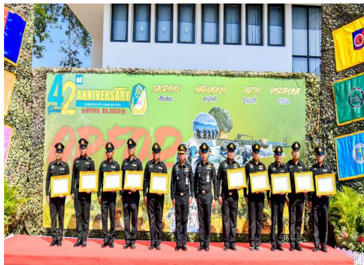
พล.ต. อาวุธ พุทธอำนาจ ผบ.ศร. ประธานในพิธีบำเพ็ญกุศล เนื่องในวันสถาปนาหน่วย ศร.พัน.๒ ครบรอบปีที่ ๔๒ ณ มณฑลพิธี ศร.พัน.๒, เมื่อ ๑๙ ม.ค. ๖๗