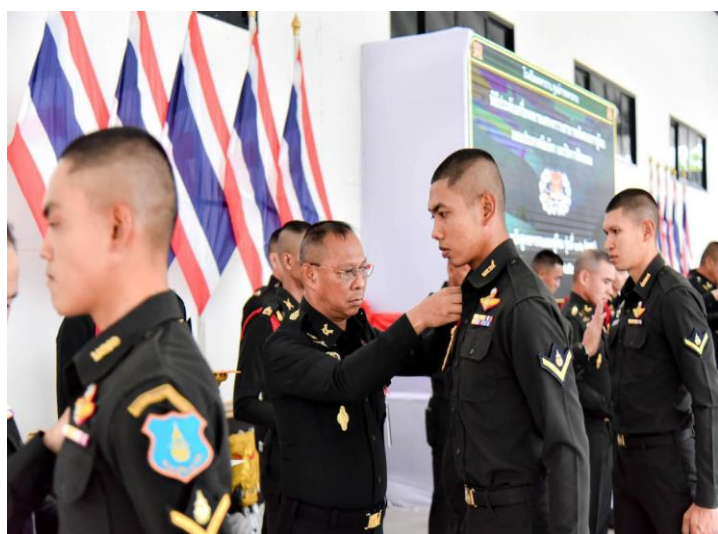
พล.ต. กัณฑ์ สถิตยยุทธการ รอง จก.ยศ.ทบ.(๑) เป็นประธานในพิธีประดับเครื่องหมายแสดงความสามารถพิเศษทหารจู่โจม มอบใบประกาศนียบัตร และปิดการฝึกอบรม หลักสูตรการรบแบบจู่โจม รุ่นที่ ๑๓๖ (นนส.ทบ.) ณ อาคารอเนกประสงค์ รร.ร.ศร., เมื่อ ๒๕ ม.ค. ๖๗