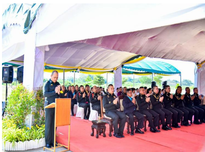
พล.ต. อาวุธ พุทธอำนาจ ผบ.ศร. ประธานในพิธีบำเพ็ญกุศล เนื่องในวันสถาปนาหน่วย ศร.พัน.๑ ครบรอบปีที่ ๑๒๒ ณ บก.ศร.พัน.๑, เมื่อ ๙ ม.ค. ๖๗